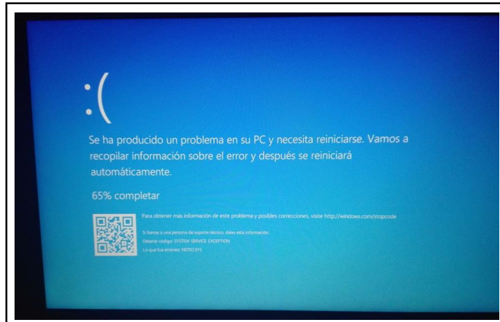
Gráfico 4: pantalla de error y reinicio del equipo de computo

Al final de cada ejecución presenta mensajes de “error fatal”, esto ocasiona que los trabajos realizados se borren, causando retrabajos y horas paralizadas hasta que la Workstation se reinicie.