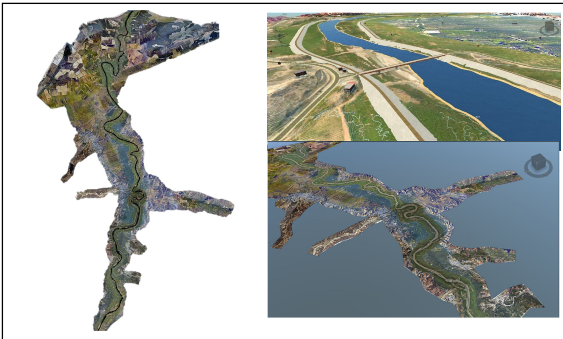
Gráfico 1: Modelo Integral dentro del Infracore

Actualmente para el modelado local se utiliza 01 Workstation para el software Autodesk Infracore 2022.